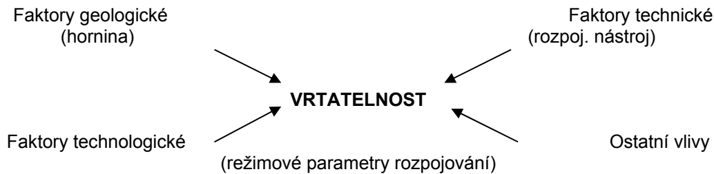
Obr. 1 Faktory ovlivňující vrtatelnost hornin.

Z uvedeného je zřejmé, že optimální řízení vrtného procesu je podmíněno definováním objektivního kritéria vrtatelnosti – měrné objemové energie [1] a instalaci měřícího zařízení na vrtné soupravě.